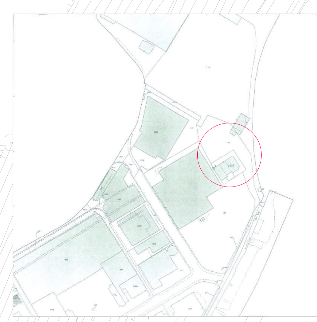
INQUADRAMENTO SU ESTRATTO DI MAPPA CATASTALE